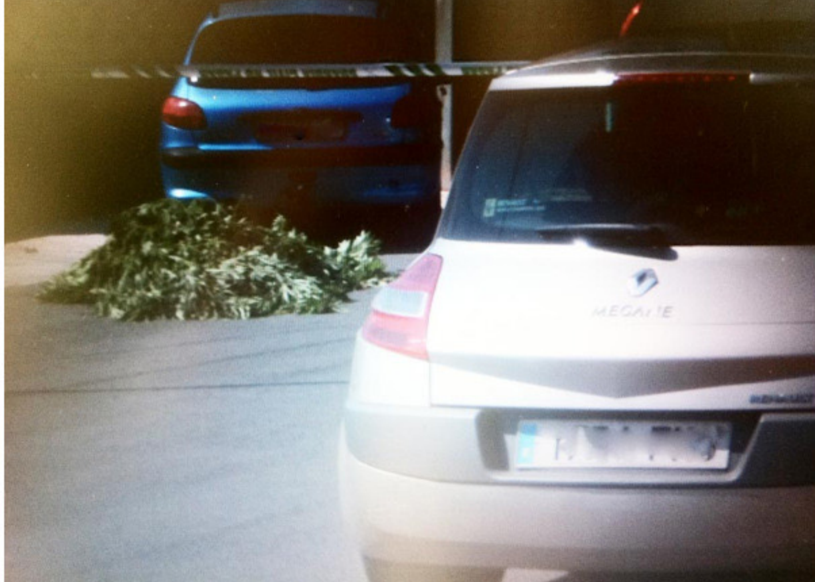
Plantas de "maría" frente a la casa del tiroteo.