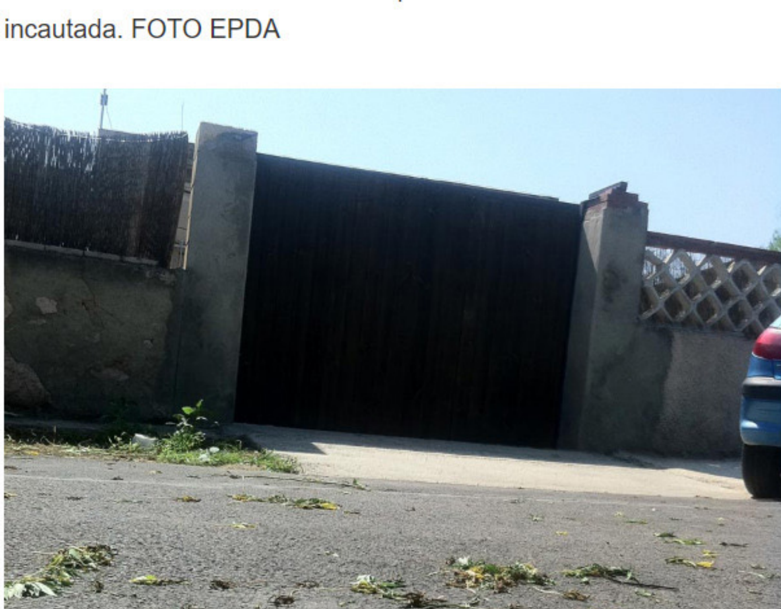
Restos de marihuana el domingo por la mañana.