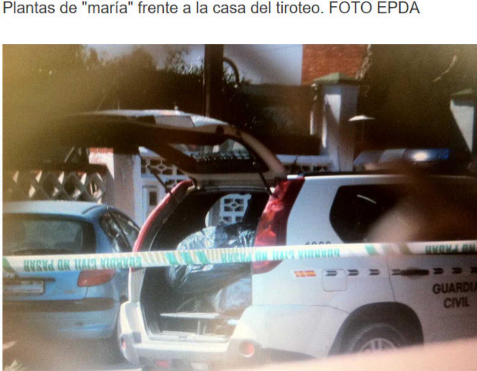
Un coche de la Guardia Civil transportando la marihuana incautada.