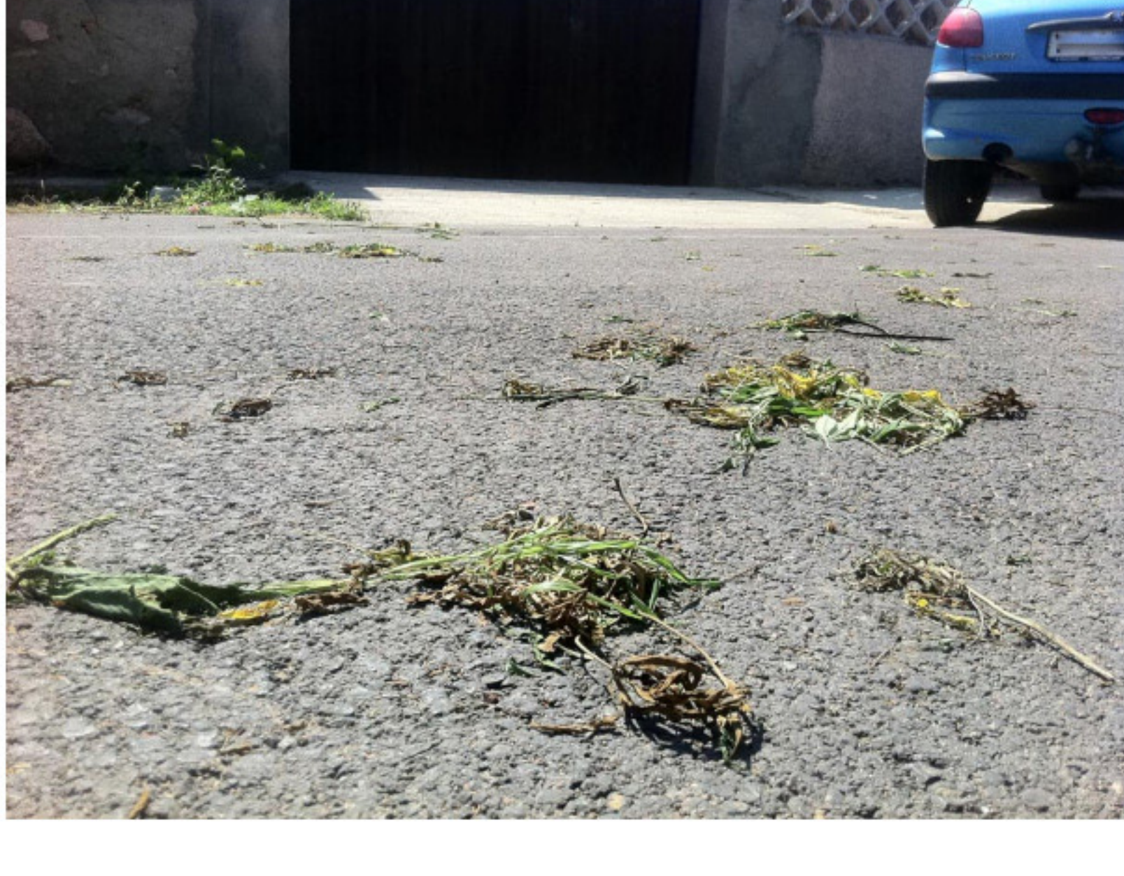
Restos de marihuana el domingo.